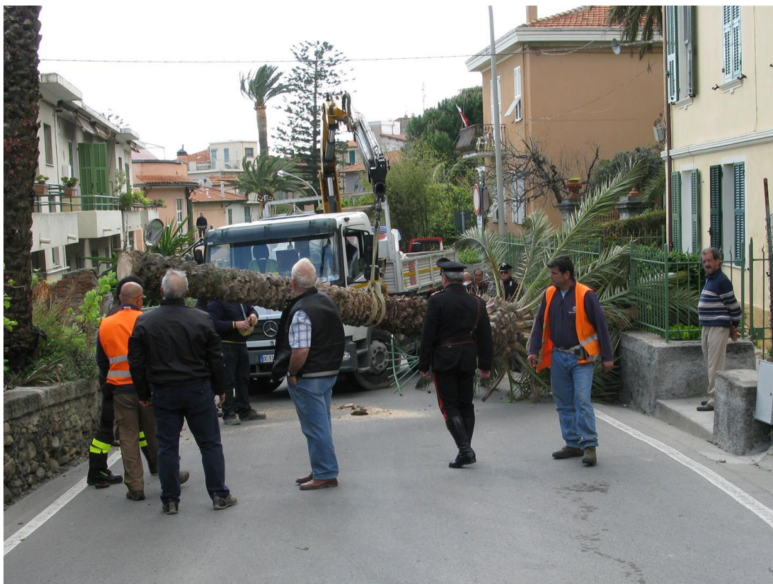
Fig. 7. En cas d'infestation basale (généralement au niveau des rejets), l'infestation conduit à la chute du stipe

Le charançon peut aussi attaquer le palmier dattier à sa base, en cas de présence de rejets. S'il réussit à migrer vers le stipe central, l'infestation entrainera alors la chute de l'ensemble de l'arbre sans aucun symptôme préalable visible. La détection précoce de ce genre d'infestation est difficile. Nous avons pu observer un cas dans notre jardin expérimental, qu'il a été possible de traiter efficacement par ablation du rejet et aspersion d'insecticide. Une mesure de prévention possible consiste à traiter (voire éradiquer) les rejets. Afin d'éviter que l'odeur de la taille attire le ravageur, il est recommandé là encore de procéder en saison froide (décembre-janvier), et de recouvrir la blessure par une application de mastic.