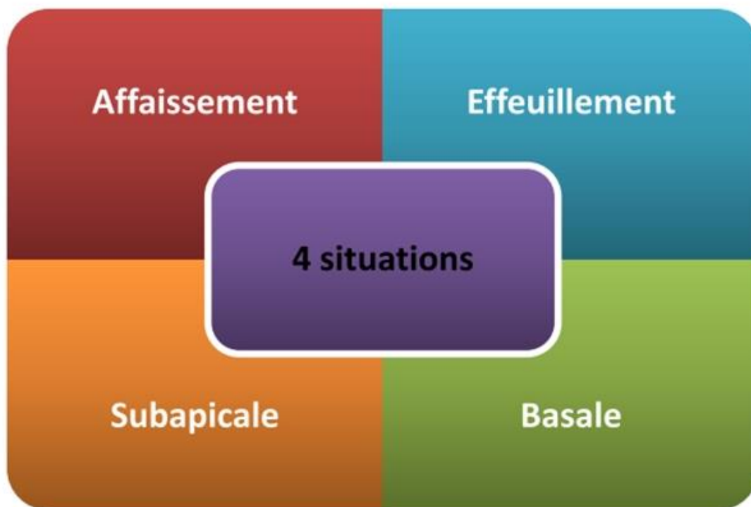
Fig 0. Synthèse des symptômes observés sur l'échantillon de palmiers dattiers suivi à Bordighera (Jardin Expérimental Phoenix)