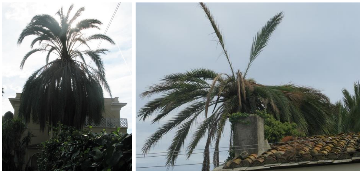
Fig. 1 & 2. le scénario type Canariensis (effondrement apical du feuillage)

La possibilité d'éviter ou de limiter les dommages repose avant tout, dans le cas du palmier dattier (outre les traitements préventifs), sur une détection précoce des spécimens infestés. Nous avons développé dans ce domaine une réelle expertise qui fait suite à plusieurs années d'observations de terrain. Nous avons ainsi recensé et observé (depuis 3 ans) près d'une vingtaine de palmiers dattiers infestés à Bordighera (sur un millier de spécimens en culture). Nos observations nous ont conduits à identifier 4 types de situations.