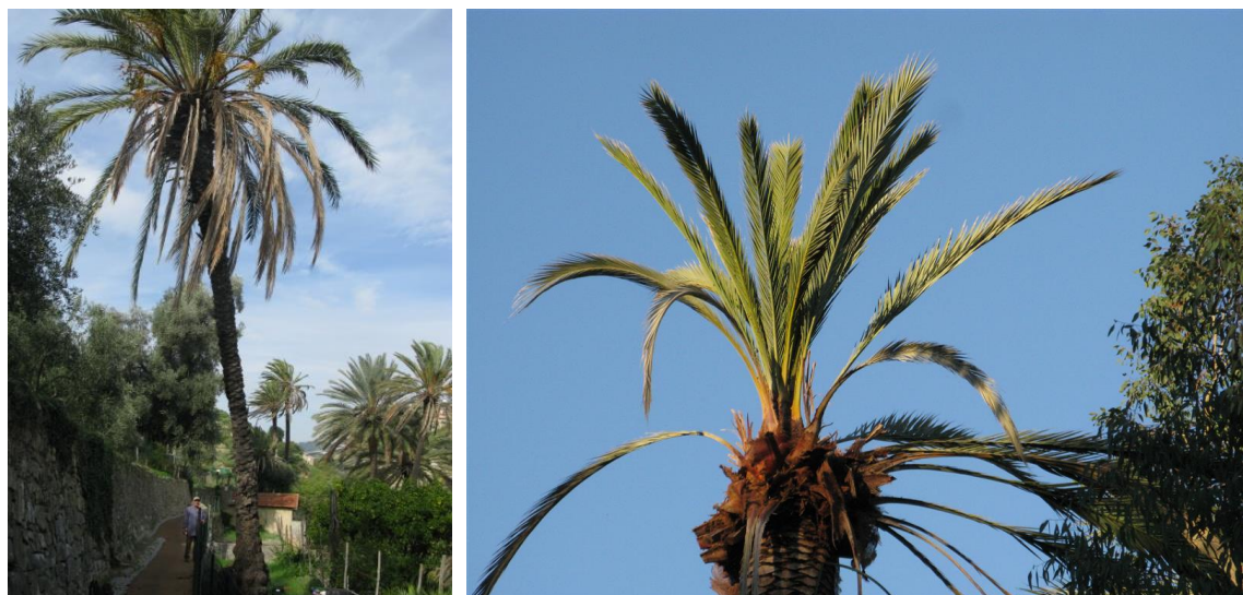
Fig. 3 & 4. l'infestation apicale latérale (effeuillement)

L'infestation due au charançon rouge se manifeste généralement chez le palmier des Canaries par la présence de feuilles rongées en biseaux. Elles ont été rongées par les larves avant leur émergence. Un autre symptôme précoce est l'inclinaison anormale d'une feuille, due au fait que les larves se sont installées à sa base pour faire leur cocon. A un stade plus avancé la couronne foliaire basse s'effondre brutalement, la partie supérieure tombe au sol et le palmier prend une forme de parasol. Le même scénario s'observe chez le palmier dattier, mais ce n'est pas systématique. La détection est généralement trop tardive pour éviter un abattage immédiat, l'autre alternative (elle aussi très couteuse) consistant dans l'assainissement du palmier.