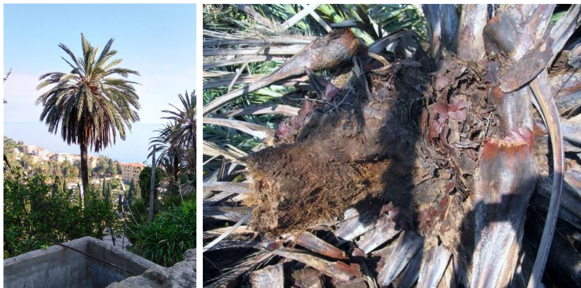
Fig. 5 & 6. l'infestation sub-apicale (inclinaison)

A leur base, on va trouver des cocons avec à l'intérieur des larves encore vivantes. La détection la plus précoce consisterait dans l'ouverture de fenêtres d'inspection lors de la taille annuelle du palmier. Afin d'éviter que l'odeur de la taille attire le ravageur, il faudrait procéder en décembre et en janvier, et recouvrir la blessure par une application de mastic. Un assainissement du palmier demeure possible dans de bonnes conditions. Là encore, la gestion de ce type d'infestation reste d'un coût élevé.